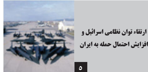
ارتقاء توان نظامی اسرائیل و افزایش احتمال حمله به ایران