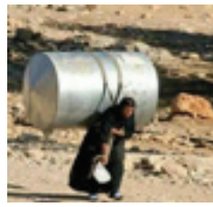
ایده در آقبانوسی از آب شرب، جان میدهد