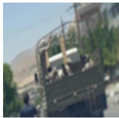
میلیتاریزه کردن شهرهای کوردستان ادامه دارد