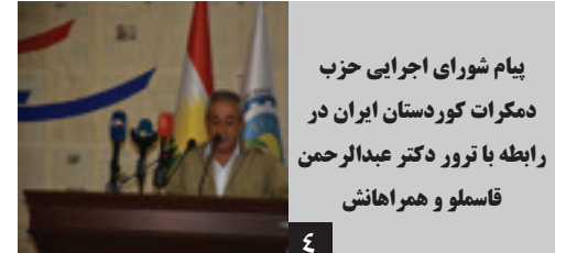
پیام شورای اجرایی حزب دمکرات کوردستان ایران در رابطه با ترور دکتر عبدالرحمن قاسملو و همراهانش