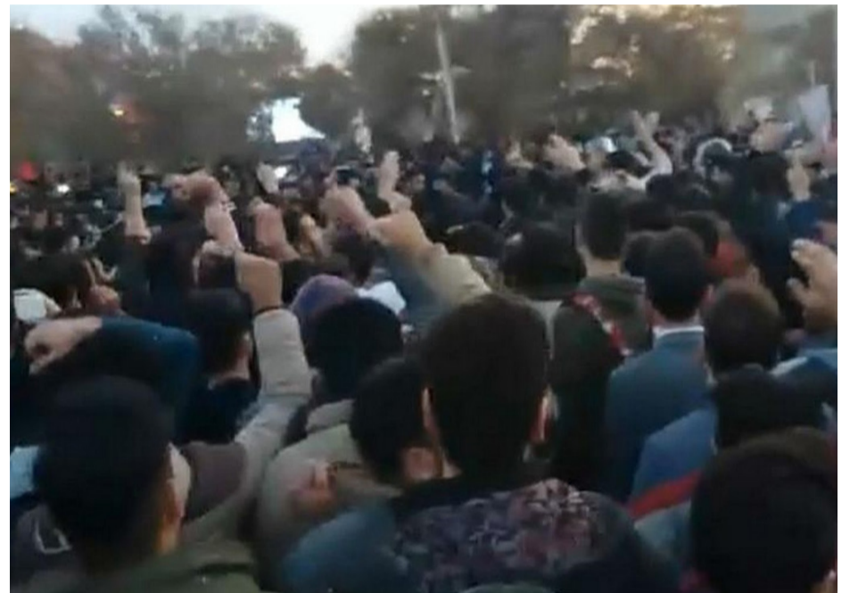
berbirûyê xelkê nerazî bikin.