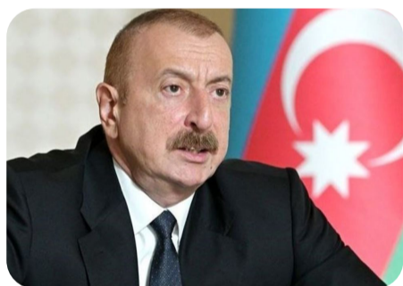
“İlham Elî Of :”

Pêşbînkirina paşeroja peywendiyên Îran û Azerbaycanê gelek aloz e