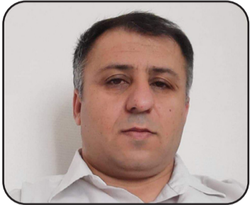
N: Serbest Urmiye

Mafên mirovan hêdî hêdî yê dibe çîrokeke tal ya dîrokê. Piştî Şerê Duyemîn yê Cîhanê, welatên endam di NY'ê de biryar dan ku mirov bi hev re di cîhanek wekehev de bijîn û di 10'ê meha Kanûnê a sala 1948'an a Zayînê de, Danezana "biryarnama" Mafên Mirovan ji bo jiyaneke baştir hate peji-randin û îlankirin.