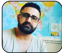
N. Hûmen Simko

Ji sala 1979’an û vir ve ku Şoreşa gelan li Îranê de bi awayekî ji aliyê axundan ve ji rê hate derxistin û dizîne, bingeha rejîmeke radîkal û binav îslamî li ser xelkê Îranê de hate sepandin. Ji destpêka desthilatdariya vê rejîma çewtekar ve li jêr navê ol, sîstemêke bi sam a dîktatorî, teror û kuştina cudabîr û rexnegiran dest pêkir û piştê bi cudaxwaz xwendina hêzên azadîxwaz ên netewên din li Îranê û ragihandina cehadê bi dijî gelê Kurd, dest bi cinayetên xwe li dijî netewên li Îranê de kir.