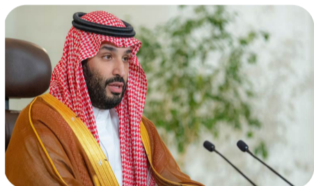
“Mohammed bin Salman”:

“Cêo Baydên Serkomarê Amerîka: Rêkevtin ji boy azadiya hejmara pitir ji 200 giroganên ku li Xezê di destê Hemasê de ne, gelek nêzîke.”