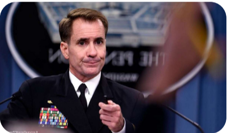
“Can Kêrbî” :

“Yûav galant Wezîrê Berevaniya Îsraîl: Emê hemî hêza xwe û bitaybet hêza leşkerî bikar bînin ji bona paşvekêşîpêkirina Hizbullaha Lubnanê bo heya paşte dizivire bo çemê Lîtanî .”