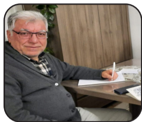
N. Roni Mazlum Deli

Ew welatên ku ez diçim betlenaye pir girîngiyê didim dîtina Muzexaneyan, her car ku diçim Muzexaneyek tiştên nû, cûda û balkêş dibînim.