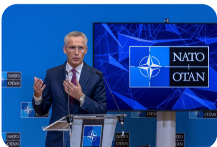
“Jens Stoltenberg” :