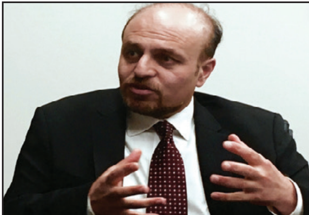
مصاحبه: شهرام میرزائی

جنبش‌های آزادیخواهانه، به بهتر مطرح شدن مسائل این جنبش‌ها کمک می‌کند. این مساله کاملا ملموس و جدی است و بی‌توجه بودن به آن قطعا در کوتاه مدت و در دراز مدت بسیار مضر است.