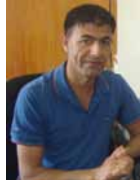
رهجيم نەخمەدى پەور

بەرباس. بەلام ئەم گىرقتە بنەرەتسىانە تەنبا بۇ چەند رۇژىك دەبنە باسى ناوئەندە ھەوالگىرىيە گىشتىيەكانو سەرلەنوى بېبەشى دەستەويەخەى كۆمەلگای وەرزىشى ژنان دەبىتتەو.