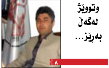
وتوویر نه گهل به ریز...