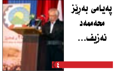
په یامی به ریز مه مه مه نه زیف...