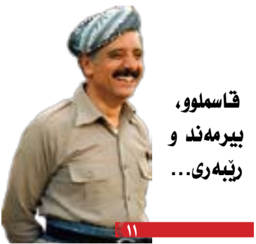
قاسملوو، بیرمه ند و ریبه ری...

دابینکردنی مافه نه ته وایه تیبه کانی گه لی کورد له چوارچیوهی ئیرانیکی دیموکراتیکی فیدرالدا