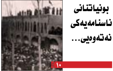
بونیاتانی ناسامه یه کی نه ته وهی...