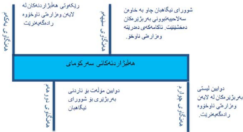
پروسه ی هه لسه نگاندنی به ربژیر دکانی سه رکۆماری

له کاتیکدا که شو و رای نی گابان لیستی به ربژیره کان لیک ده داته وه، کاندیدا کان ئه و ده ره تانه شیان هه یه که زانیاری، یان شه هاده ی پشتراسته که ره وه ی خاوه ن سه لاحیه ته بو ونیان بنیرن. شو و رای