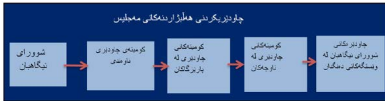
چاودێری هە‌لبژاردنە‌کی مە‌جلیس له‌ لایە‌ن شوورای نی‌گابانە‌وه‌