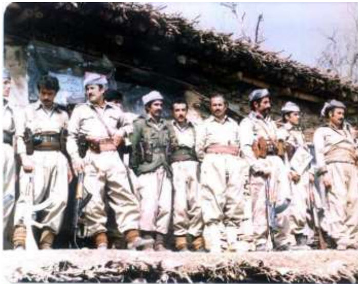
کۆمیتته شارستانی سه‌ردهشت - سالی ۱۳۶۴