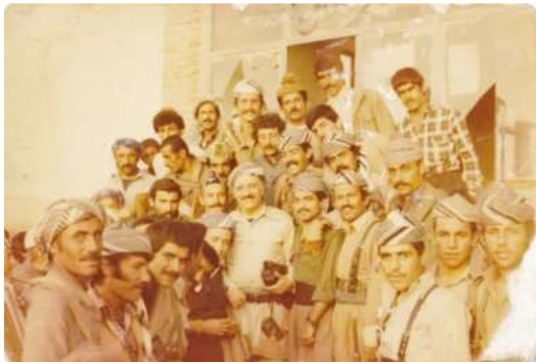
نوبار - ہاوینی ۱۳۶۱