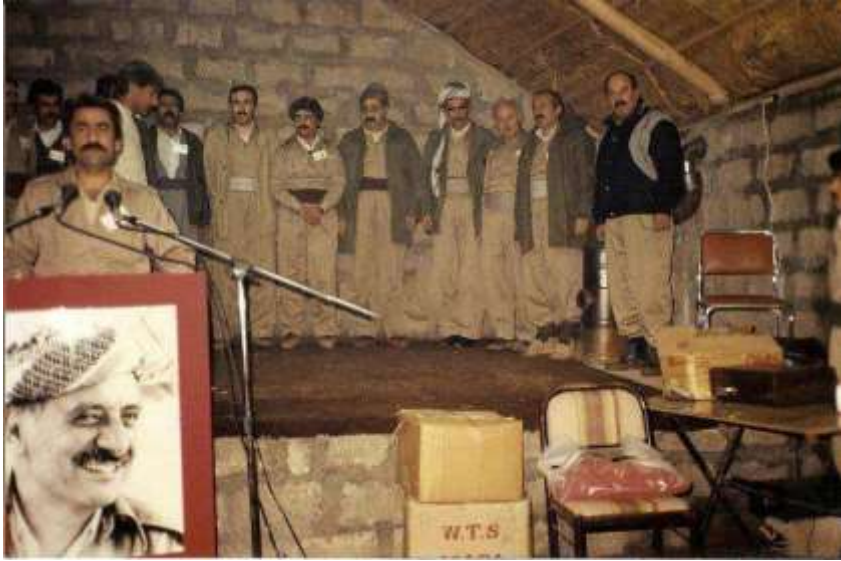
کۆنگره‌ی ۹، کۆنگره‌ی قاسملوو - به‌فرانباری ۱۳۷۰ (دیسامبری ۱۹۹۱)