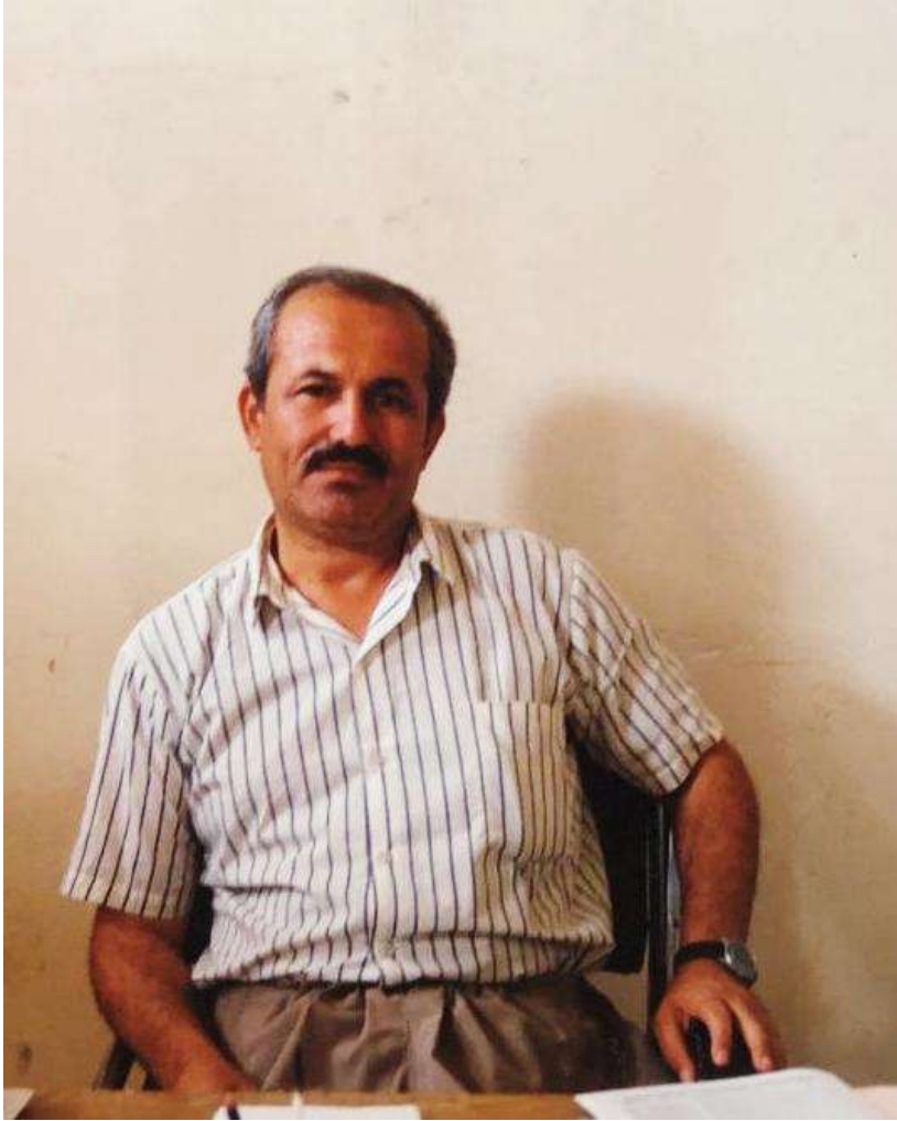
ژووری کار له کۆمیسییۆنی سیاسی نیزیامی