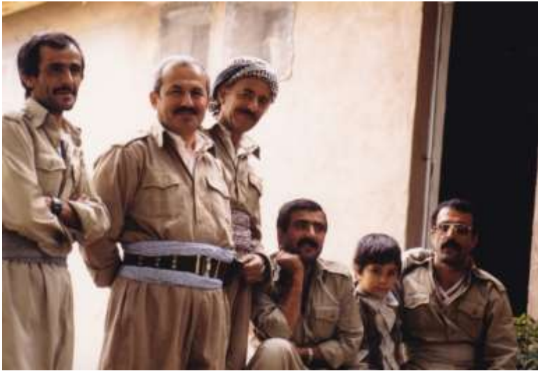
فێرگه‌ی حیزب له قه‌ندیل - ساڵی ۱۳۶۸