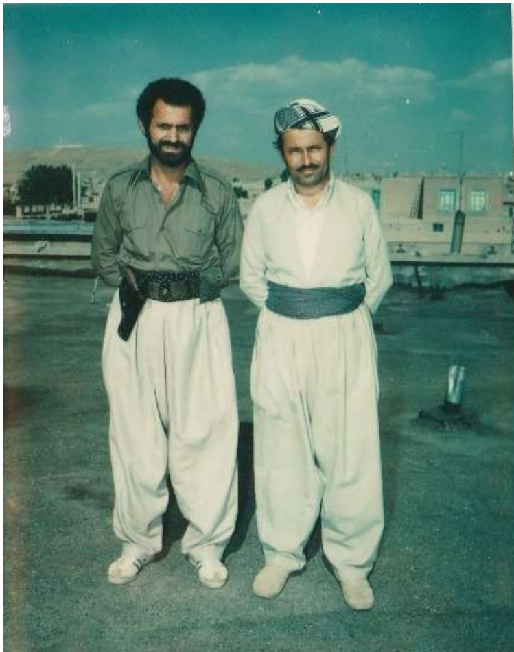
بۆکان - هاوینی ۱۳۵۹