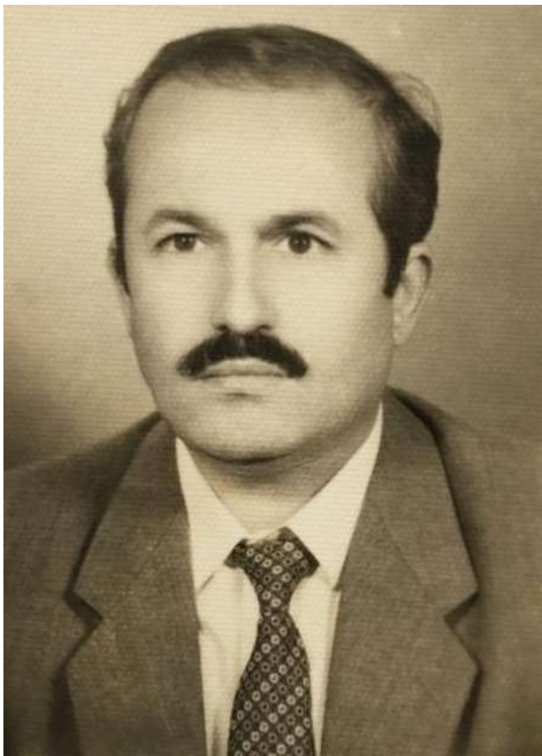
بہغدا - سالی ۱۳۶۷