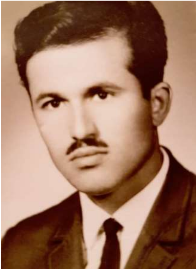
مههاباد - سالی ۱۳۵۰