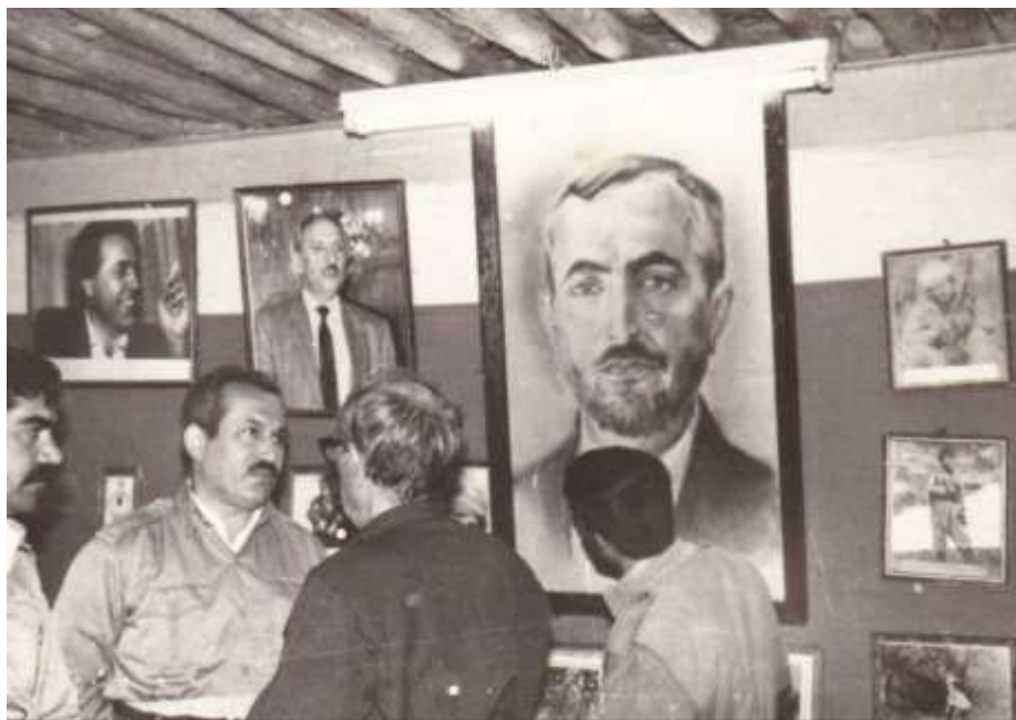
۱۰ی خاکہ لیتوہی سالی ۱۳۶۹