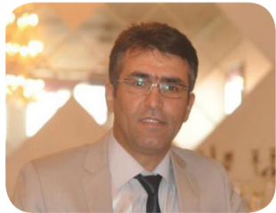
N: Azad Kurdî

Oktobera reş careke din li derê kurdan xişt. Mixabin di naverasta meha Oktobera 2019'an de, hêzên leşkerî yên Turkiyê û çekdarên Sûrî ku Turkiyê piştgiriya wan dike, bi armanca dagirkirina axa Rojavayê Kurdistanê, hêriş bo ser Rojava dest pê kirin. Qonaxa yekemîn dagirkirina Efrîn bû û niha armanca wan dagirkirina hemû Rojavayê Kurdistanê ye. Ev yek dibe qonaxeke nû di jiyana siyasî ya Rojavayê Kurdistanê de.