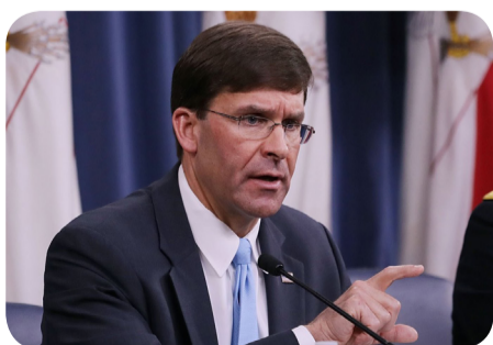
Mark Esper :

“Heyama tehrîmên Neteweyên Yekgirtî ên li ser çek û teqemeniya rejîma Îranê yek sale bi ser de diçe”.