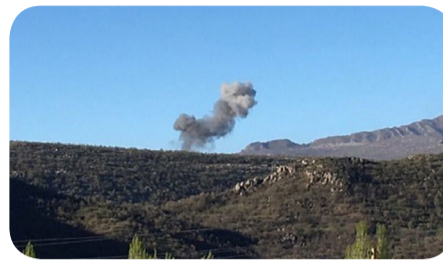
Çiyayê Xwakurkê dikeve di navbera bajarê Şinoyê ya Rojhilatê Kurdiştanê û

Heya niha termê wan du welatîyên Kurd radeştê malbatên wan nehatiye kirin.