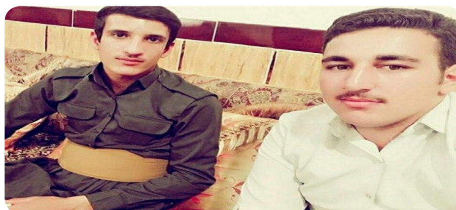
Heya dema belavbûna vê nûçeyê ji sedema binçavkirin û cihê girtina wî welatîyê Kurd ti zanyariyek ji ber deşt de nîne.

Hêzên ewlehî di gundê Kanîreşê êriş kirine ser mala wî welatîyê Kurd û deşt bi vekolîna mala navbirî kirine û herwisa hindîk ji kelûpelên wî yê wekî Kampiyûtera û hin tiştin dinê de girtine û digel xwe birine.