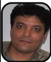
N: Selam İsmailpûr

Di ola Zerdeştîyê de her û her şîretên bona paraştin û paqîşkirina xwezayê ya li cîhanê tê kirin. Her weha di yalekta xwezayê di her warî de bi hûrbînî tê ravekirin.