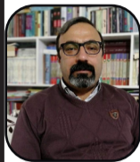
N: Elî Bidaxî

Hejmara welatên endamên Neteweyên Yekbûyî di sala 1945’an de ji 51’an gihîştîye 149’an û ji sala 1980’î ve bûye 206, ku 196 ji wan endamên Neteweyên Yekbûyî ne. Sedema bingehîn a van guhertinan prensîba mafê çarenivîsê ye ku di heyama kêmtir ji 80 salan de zêdetir ji 150 gel û neteweyan bûne xwediyê pêkhateyên siyasî yên serbixwe û çarenivîsa xwe diyar dikin.