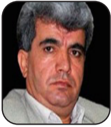
N: Roştem Cihangîrî