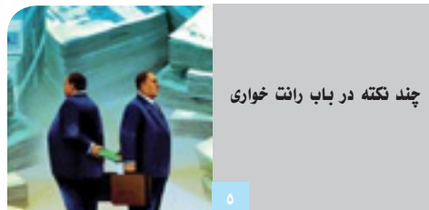
چند نکته در باب رانت خواری