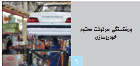
ورشستگی سرنوشت محتوم خودروسازی