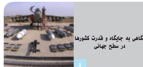
نگاهی به جایگاه و قدرت کشورها در سطح جهانی