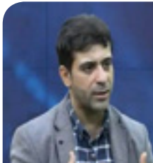
دیمانه ی کوردستان

ژماره ٧٩٩، هه یینی ٣١ بانه مه ری ١٤٠٠ ای هه تاوی، ٢١ مه ی ٢٠٢١