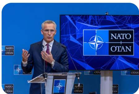
“Jens Stoltenberg” :

“Nêçîrvan Barzanî: Îraqeke bihêz hewcehî bi Herêma Kurdistanê ye û Herêma Kurdistanê ya bihêz jî hewcehî bi Îraqeke federal û aram e.”