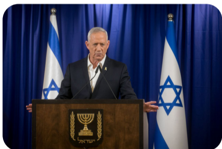
“Ultimatuma Gantz” :

“Bi mirina Îbrahîm Reîsî ya muhtemel tu guhertinekê di siyas-etên Komara Îslamî de dernaxe, ji ber ku her tişt di destê rêberê rejîmê Elî Xamineyî de ye”