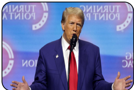
“Donald Trump” :

“Rewşa siyasî û ewlehî ya Rojhilata Navîn dê bandorê li Iraqê bike”