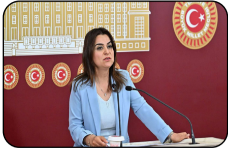
“Gulîstan Kiliç Koçyîgîtê”:

“Qeyûm ne tenê çavkaniyên gel tune dike, di heman demê de ziman, çand û jiyana herêmê jî tune dike”