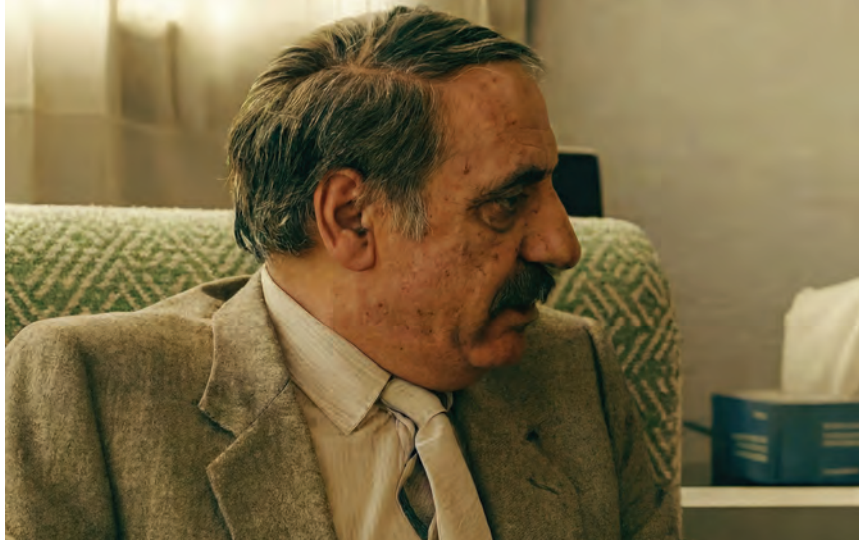
شار و دێ شینتر له پدنگی خه‌م له چاوی ئاسمان پیاو و ژن ده‌ریا ده‌پوشن چه‌شنی ساوی ئاسمان

بووشپه‌ره و تازه هه‌ناسه‌ی چه‌م به ساردی دێته‌ دهر نووته‌که و ههر بواری شینه‌ی بۆ هه‌تاوی ئاسمان