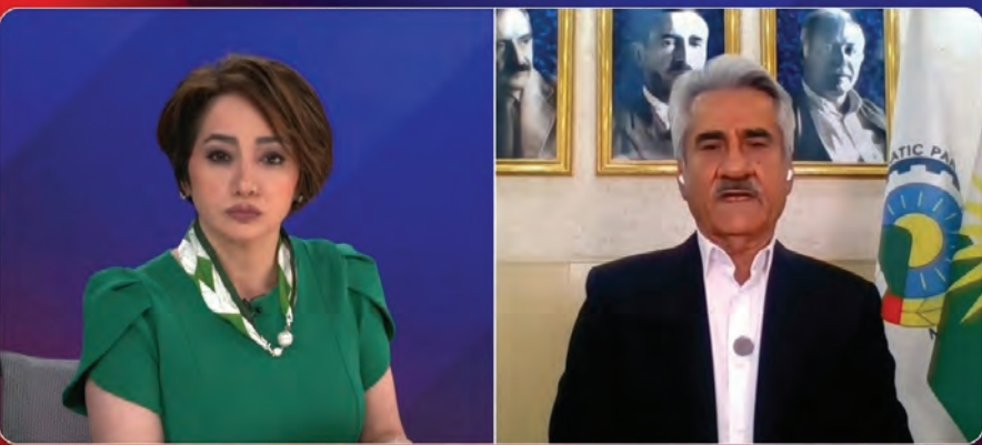
هیدان راز شیکه‌های اجتماعی نهادی امریکا دنیان کتید

خه‌باتیکی سیاسی، مه‌دهنی و جه‌ماوه‌ری له ئاستی سهرانسهریدا ده‌توانیت بییکیته. هاوکات ده‌شزانین که خه‌باتی چه‌کداری ده‌بیته هوی سه‌رکوتی زیاتر و خویناویتری بزوتنه‌وه‌ی کورد و خه‌لکی کوردستان. سه‌رکوتی گشتی حیزب له ولامدانه‌وه به‌و پرسپاره که ئاخو ئه‌وه هر روانگی ئیوه‌یه یان هه‌موو پریه‌ری حیزب، گوتی له حیزبی دیموکراتدا بریاره‌کان تاک نایدن و هه‌موو بریاره سیاسی و گرینگه‌کان له کونگره و کومیتته‌ی ناوه‌نیدا به‌کومهل دهرین و ئه‌و سیاسه‌ته‌ی ئیستا به‌کومهل بریاری له‌سه‌ر دراوه. به‌ریزیان به‌ ئامازه به‌وه‌ی له‌وانه‌یه چاوه‌روانی خه‌لکی کوردستان به‌تابیه‌ت لاوان له دوا‌ی بزوتنه‌وه‌ی ژیناوه بۆ خه‌باتی پيشمه‌رگانه‌ی حیزب زیاتر بوو، به‌لام سیاسه‌تی دروست و واقعی‌نایه‌ی حیزب ئه‌و تیگه‌ستن و قه‌ناعه‌ته‌ی لای ئه‌وانیش دروست کردوه و به‌و پینه‌ی ده‌توانین بلین پیگه‌ی سیاسی و جه‌ماوه‌ری حیزبی دیموکرات له جارایش به‌هیزتره.