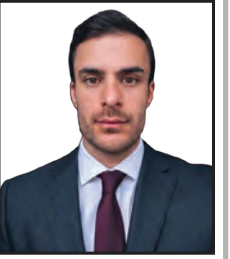
میرخان شه‌مسی بورهان

کۆماری ئیسلامیی ئێران هەر له سه‌ره‌تای هاتنه‌سه‌رکاری له‌ سالی ۱۳۵۷ی هه‌تاویدا (۱۹۷۹)، تاقه‌یه‌ک زمانی بو گه‌فتوگۆ و دانوستان له‌گه‌ل نه‌ته‌وه‌ی کورد هه‌بووه‌: زمانی سێداره‌ و قهرکردن. ئه‌وه‌ی مێدیا به‌ژه‌وه‌ندێخوازه‌کان ناوی ده‌نێن «پیشیلکردنی مافه‌کانی مرۆڤ»، له‌ راستیدا سیاسه‌تیکی بنه‌مابۆدانراوی ده‌وله‌تییه‌؛ تیرۆری ده‌وله‌تی پێکخراویکه که ئامانجه‌که‌ی کێکردنی هەر دهنگیکی ئازادێخوازه‌ له‌ کوردستاندا. هەر پەتی سێداره‌یه‌ک که له‌ بنه‌دیخانه‌کانی ورمی، سنه‌ و مه‌هاباد و ناوچه‌کانی دیکه‌ی کوردستاندا هه‌له‌واوسریت، نه‌ک سزادانی «تاوانباریک»، به‌لکوو په‌لامیکه‌ بو نه‌ته‌وه‌یه‌ک: یا ملکه‌ج به‌ و سه‌ر نه‌وی بکه‌، یا بمره‌!