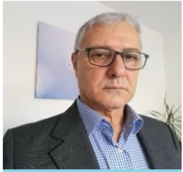
N. Xidir Ūso

Ez di sala 1980yê de, piştî darbeya leşkerî ji ber doza PDKT-KUKê hatim girtin. Min cezaya hefsa muebetê xwar.