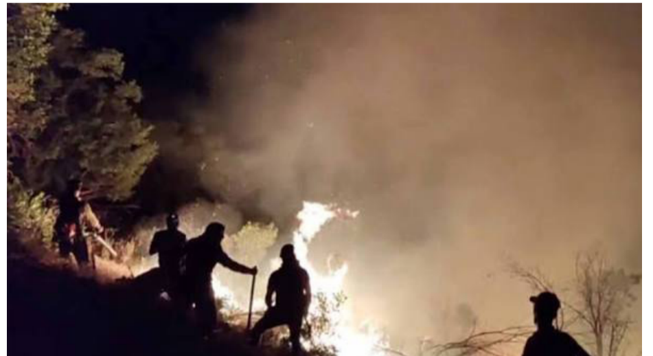
Jî dixê bin metirsiyê û egera hişkesalî û şewatê zêde dike.

Ji mijarên din ku çalakvan balê dikişînin ser, mijara çavkaniyên avê ye. Ew di vê baweriyê de ne ku rêjîma Îranê bi polîtîkayên xwe çavkaniyên ava Kurdistanê xistiye bin meyrîsiyê û li hinek herêman, av bi şewazekî tê birêvebirin an veguhastin ku li Kurdistanê encamên nerênî jî jîngeh û jiyana mirovan re tîne. Kêmkirina çavkaniyên avê ji bilî bandora li ser çandiniyê, jiyana giya û ajalên