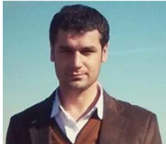
N. Adil Direxîşanî W. Hesên Mukerem

Bê guman, cîhan di warên zanist, teknoloji û ragihandinê de bi lezeke bêhempa pêş dikeve. Her roj, kampanyên mezin berhemên nû, şewazên jiyane yên nû û xewnên nû derdixin holê da ku bala nifşê ciwan bikişînin.