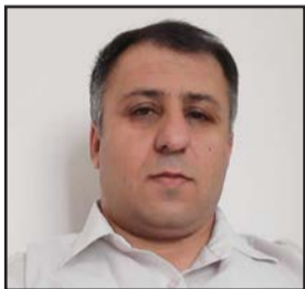
N. Serbest Urmiye

Êrîşa mûşekî ya rejîma Îranê ya bi navê “Soza Sadiq 2” li dijî Îsrayîlê ku doma siyasetên şerxwaz ên rejîma Îranê li herêm û cîhanê de ye, Di hizra rejîmê de him weke hewlekê bo nişandana hêza leşkerî û selimandina teknolojiya xwe ya şerxwaziyê bi cîhan û nemaze Îsrayîl û dewletên herêmê jê dihat mêze kirin û him jî bi hêviya xurtkirina piştgiyaya navxweyî ji rejîmê gav dihavêtin.