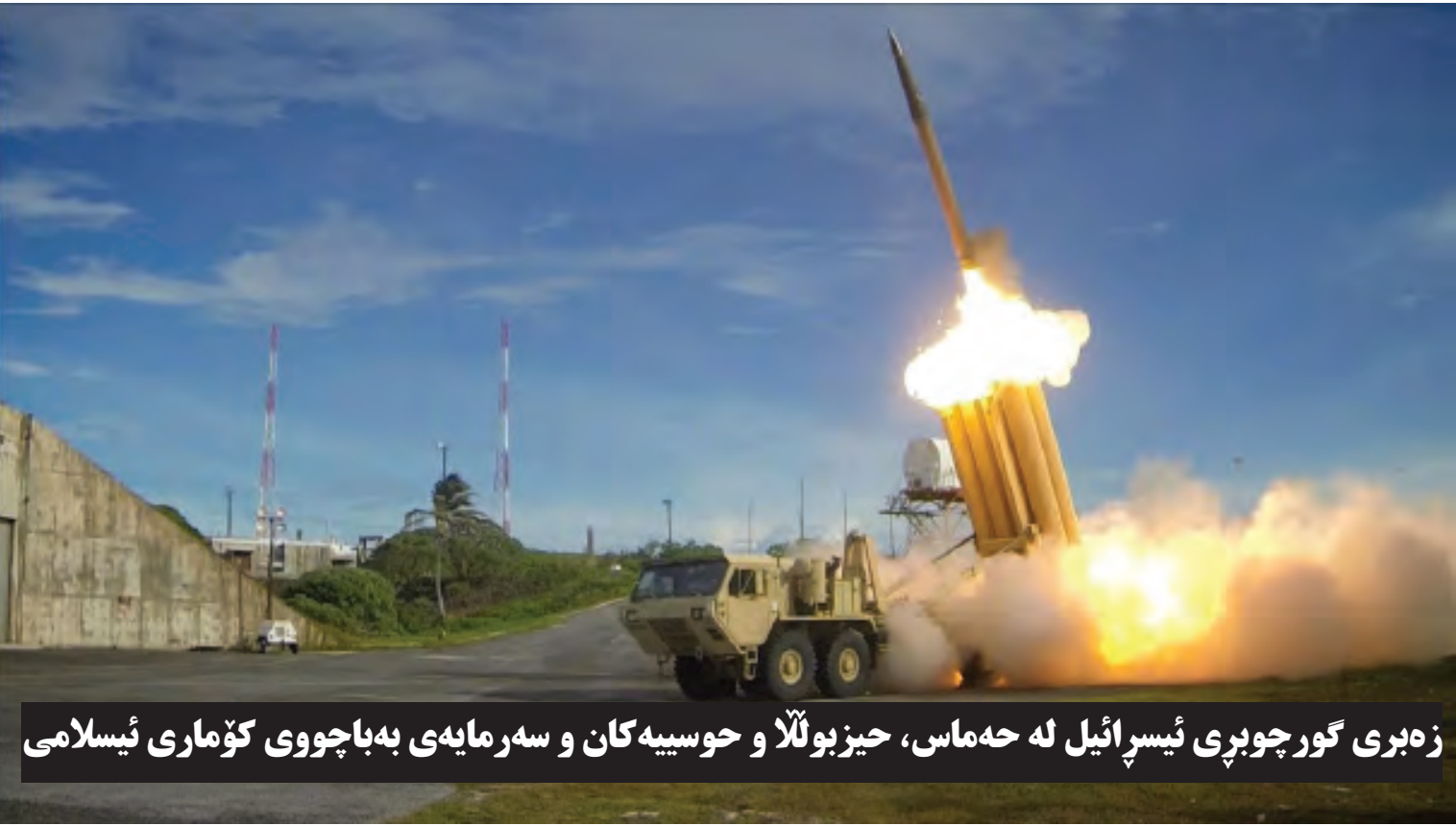
زه‌بری گورچوپری ئیسراییل له‌ هه‌ماس، حیزبۆللا و حوسیه‌کان و سه‌رمایه‌ی به‌باچووی کۆماری ئیسلامی