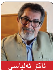
ئاکو ئه لیا سی

له م قوناغه دا، نه شاعیر ئه و شاعیره راراییه بیده سه لاته ی سه ره تای شاعیره یته تی و نه شاعیره کانی شی، وشه کرچ و کاله کانی ده سپیکی خه ونی