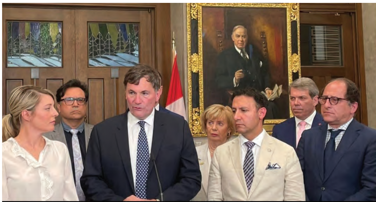
کانادا: له ئیستاوه سپای پاسداران بهرهمی به ریکخراویکی تیروۆریستی دهناسین