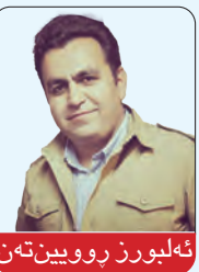
ئەلبورز پروین تەن

یهکیک له هەلبژاردنە گرینگەکانی دۆنیا، هەلبژاردنی سەرۆک کۆمار یی ئەمریکایه، چونکه کاریکەری ئەمریکا له ئاستی جیاوازدا به سەر سیاسەتی