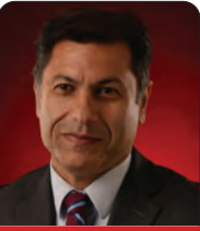
ئهممه د مه ممه دپووڤه

خوى ده خاته چوارچيوه يه كى ميژووييه وه، كه تيبدا به دوا داچوون بۇ نه سه بنامه يه كى كلاسيك يان هاوشيوه ي دهسه لات دهكات بۇ دهسته به سه رداگرتنى شته كان، كات، چه سه ت و له كوتاييشدا خوى ژيان كه له لايهن دهسه لاتي پيش مۇديرنه وه بۇ سه ره لاندنى هيزى بايو لوژى له دهوله ته مۇديرنه كاندا به كارده هيتريت. له كاتيكدا فورمى دهسه لاتي پيش مۇديرنه له پاشا يان سولتانداندا درده كه وت و ئه و تاكه كه بوو كه مافى ئه وهى هه بوو ژيانى كه سيك ببات يان ربيگه بدات بژى، شيوه ي مۇديرنى دهسه لات نهك تنها هه ره شه ي جيبه جيكردنى مەرگ دهكات، بهلكو مافى ئه وهى هه يه ژيان دريژ بكاتوه يان تا ئاستى مردن. فوكو هيزى بايو لوژى و هيزى ديسپلين وهك دوو فورمى په يوهنديدار، به لام جياواز له دهسه لات وه سف دهكات. له كاتيكدا هيزى بايو لوژى وهك دهسه لاتى به سه ر زينده و ژياندا پيناسه دهكات، دهسه لاتي ديسپلين ئه و دهزگا و دامه زراوانه دهكرىته وه كه له ربيوه دهسه لاتي بايو لوژى پراكتيزه دهكات و كارى پى دهكات. به كاره يتانى سهروه رى برىتبه له به كاره يتانى هيزى زيندو له ربىگه ي دامه زراوه ديسپلينييه كانه وه له سه ر مردن و پيناسه كردنى ژيان وهك دريژبوونه وه و دركه وتتى دهسه لات. به و مانايه، هيزى بايو لوژى نهك هه ر حكومه تدارى