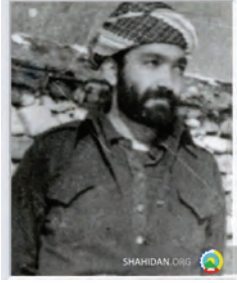
شهید مه‌لا سمايل کوردنژاد