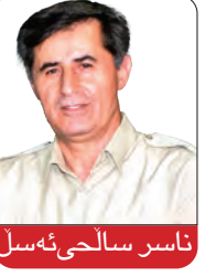
ناسر سالحی ئەسڵ

له ماوهی سی دهیهی رابردوودا نارېزایه تی جه ماوهری گهلانی ئیران له شیوه و کات و ساتی جوړاوجوړدا دژ به ریژی می کوماری ئیسلامی وهک خسه لتیکی گرینیکی کولندهدان و مافخواری به شیوازی هم مه رنگ درژی وهی بووه. ههر ئه نارېزایه تیانهش له ماوهی ئه وه سی دهیهیدا پیگه و جیگه ی کومه لایه تی و سیاسی کوماری ئیسلامی له ناستی گهلانی ئیراندا بنگول کردوه. گرینیکی نارېزایه تیبه جه ماوهریبه کانی سهر شه قامی گهلانی ئیران، ده توانین له دوو ره هنده و بورادا پولین بهندی بکین: