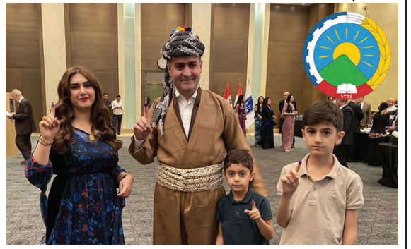
بەبیامی بیرۆزبایی ناوەندی بەریۆەبەریی حیزبی دیموکراتی کوردستانی ئێران بەیۆنەیی بەریۆەچوونی هەلبژاردنەکانی پارلمانی هەرییمی کوردستان

پۆژی یەکشەممە ۲۹ی رەزبەر (۲۰ی ئۆکتۆبری ۲۰۲۴) شەشەمین خولی هەلبژاردنەکانی پارلمانی هەرییمی کوردستانی عێراق لە کەشیکێ ئازاد و دیموکراتیکدا بەریۆە چوو.