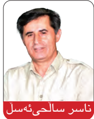
ناسر سالحی ئەسل

پاش سه‌ره‌كوتنى شوڤرى گه‌لانى ئێران، په‌په‌هه‌ستبوونى پۆلیك له‌ ئەفسه‌رانى خهباتگێر و نیشتمانپه‌روه‌رى كورد به‌ ریزه‌كانى هێزى پيشمه‌رگه‌ى كوردستان و به‌ تابه‌ت به‌ ریزه‌كانى حیزبى دیموكراتى كوردستانى ئێران، به‌ قوناغیكى گرینگ له‌ مێژووى خهباتى رزگارىخوازى و نته‌وه‌یه‌ى دیموكراتیکه‌ى گه‌لى كورد له‌ رۆژه‌لاتى كوردستان ده‌ژمێردى. به‌ خۆرىكخسته‌وه‌ى سه‌ر له‌ نوێى حیزبى دیموكراتى كوردستانى ئێران له‌ ژێر تیشكى رینۆتییه‌كانى ریبه‌رى مه‌زن دوكتور قاسملوى نەمر، به‌شیک له‌ ئەفسه‌ر و دهره‌جهدارانى شوێشگێرى كورد،