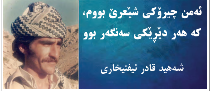
ئەم چیرۆکی شیعری بووم، که هەر دێرێکی سەنگەر بوو