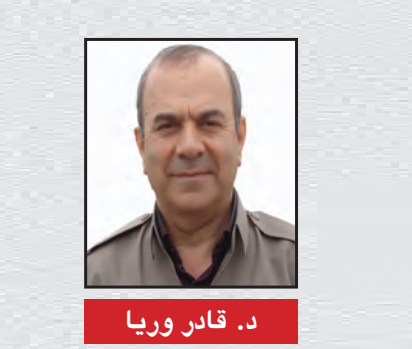
د. قادر وریا

وا دیته‌ به‌رچاو که‌ میرانگرنی خامه‌نیه‌ی، شارده‌نه‌وه‌ی ته‌رمی رێبه‌ری سیاسیی- دینی خۆیان بۆ کاتیک هه‌لگرتوووه‌ که‌ به‌ خه‌یالی خاوی خۆیان له‌م شه‌ره‌دا سه‌ر ده‌که‌ون. جاری ڤوون نییه‌ که‌ چاره‌نووسی ئه‌م ڤیژمه‌ به‌ هۆی شه‌ریک که‌ خۆی هۆکاری هه‌لگیرسانیه‌تی به‌ کوێ ده‌کات، به‌لام ئه‌گه‌ر مانه‌وه‌ و ڤزگاربوونیکیش له‌م شه‌ره‌دا بۆ ئه‌وان هه‌بیت و به‌ پیکه‌پێانی گه‌وره‌ترین ڤیوره‌سه‌مه‌کانیش بۆ ژیرخاک کردنی، ناتوانن سیمایه‌کی جیاواز له‌وه‌ی هه‌بوو، له‌م دیکتاتۆره‌ به‌ خه‌لکی ئێران و جیهان نیشان بدن. ئه‌و رۆژه‌ی دیکتاتور ده‌خړیته‌ گۆر، ڤرسیاریک که‌ خه‌لکی ئێران و جیهانییه‌کان له‌ باره‌ی خامه‌نیه‌ی له‌ خۆیانی ده‌که‌ن، ئه‌وه‌یه‌ که‌ ئه‌و رێبه‌ره‌ سیاسیی و ئایینییه‌ی ڤیژمی ئێران، له‌ ماوه‌ی دوور و درێژی ده‌سه‌لاتدارییه‌که‌یدا ولاته‌که‌ی خۆی به‌ کوێ گه‌یاند و چ میراتیکی له‌ دوا یه‌کی خۆی به‌جی هیشته‌؟ خامه‌نیه‌ی ئه‌و دیکتاتۆره‌ بوو که‌ هه‌موو جومگه‌کانی ده‌سه‌لاتی ولاته‌که‌ی له‌