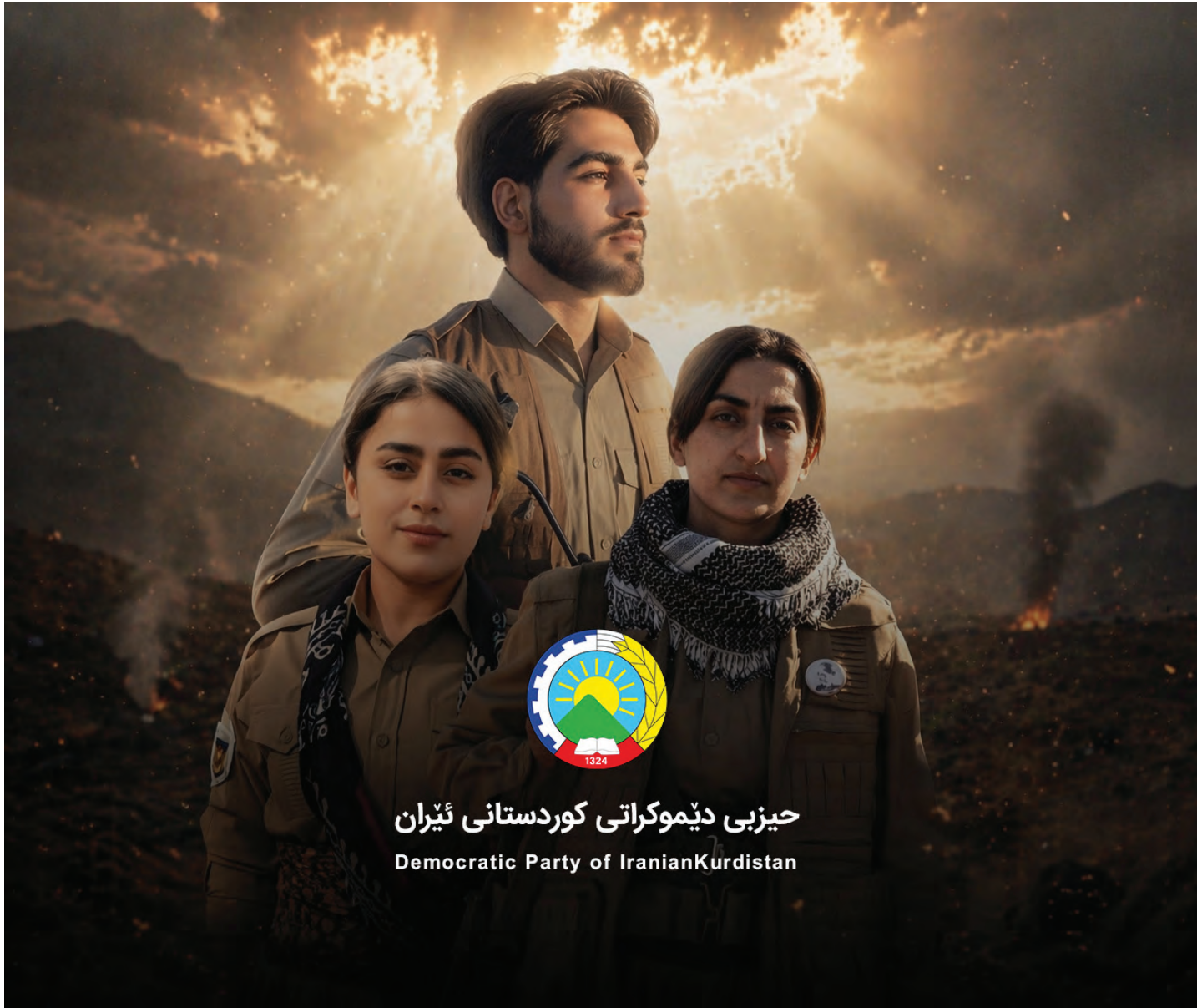
حیزبی دیموکراتی کوردستانی ئێران Democratic Party of Iranian Kurdistan