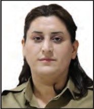
د. ئارەزوو نىستانى

كىشەى ئىران و ئەمىرىكا يان بە واتايەكى دروستىر كىشەى ئىيران لەگەل كۆمەلگەى ئىودەولەتى و نەزمى جىهانىيى ئارايىيدا، كە بەرھەمى ناكارايى ئەنجومەنى ئاسايشە وەك گرېنگىترىن دامەزراوەى برىاردەرى ئىودەولەتى، لانىكەم دوو دەيەپە لە رېگەى دىپلۇماسى ھەولى چارەسەر كىردنى دەدرى. دەسپىكى ھەولە دىپلۇماسىيەكان بە شىۋەيەكى چىر و ئاشكرا دەگەرپىتەوہ بۇ سالى ۱۳۸۳ كە ھەولەكانى ئىزان بۇ پەرەپىدانى بەرنامە ئەتۇمىيەكەى بەشنىۋەى نىاروون ئاشكرا بىو. سەرنەكەوتنى ھەولە دىپلۇماسىيەكان و ملنەدانى ئىزان بۇ چارەسەرى ئاشتىانەى ئەو پرسە و سەرەنجام سزادانى كۇمارى ئىسلامى لەلايەن كۆمەلگەى ئىودەولەتى بە مەبەستى پاشەكشەپىكىردنى لە سىياسەتە ئاژاۋەگىرانەكانى چ لە رېگەى ئابلۇقەى ئابوورى و تەنانەت لە رېگەى بەكارھىتانى ھىز، نەك نەپوتانى بىيىتە ھۆى گۆرپنى ھەلسوكەوتى ئەو رېژىمە و پابەندكىردنى بە جىيىەچىكىردنى بنەماكانى ياساى ئىودەولەتى و رىزىكرتن لە نەزمى ئارايى جىهانى، بەلكو رېژىمى ئىرانى بەرەو كرتنەبەرى كۆمەلئىك پىشلىكارايى دىكەى وەك پەرەپىدان بە بەرنامە موشەكىيەكانى و رىكخستن و پرچەككىردنى گروپە نىابەتتىەكانى و لە ئىستاشدا مەترسى خستتە سەر ئازادىي بازىرگانىي جىهانى لە گەرووى ھۆرمز ھان دا.