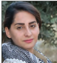
ناسۆ مینه بری

پچرانی ئینتیرنیت ته نیا پیوه ندییه کۆمه لایه تیه کانی نه پساندو وه، به لکو وانی زۆر که سه ی بریوه. بۆ هه زاران ژن له ئێراندا، ئینتیرنیت شوینی کار و ته نیا ریگه ی چوونه نیو قو لایی ئابووری بوو که ده رگا کانی له جیهانی راسته قینه دا بۆ ئەوان داخرا وه.