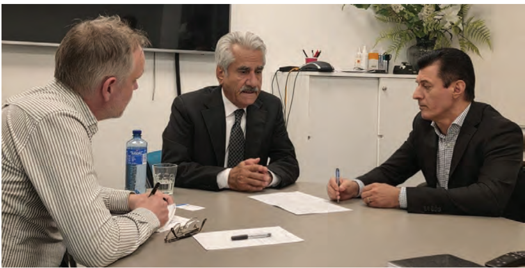
دهقی وەرگێردراوی وتوێژی سکرێتێری گشتیی حیزب لەگەڵ رۆژنامەیی سویدی سوینسکا داگ بلادیت

سەفەری ئوروپایی سکرێتێری گشتیی حیزبی دیموکراتی کوردستانی ئێران. نێوەرۆکی بەرنامەکانی ئەو سەفەرەش بە نەپتی دەمێنێتەوە. مستەفا هيجری دەلی حیزبی ئێمە چەندین جار تووشی هیرشی تیزۆریستی بۆتەو، بۆیە لە سەفەرەکانیدا هەموو کات هەرهەشی گەورە لەسەرە. ستۆکھۆلم یان باقی پێتەختەکانی ئوروپا لەو هەرهەشانە پارێزراو نین. سالی ۱۹۹۲ی زایینی، دوکتور سادق شەرەفکەندی سکرێتێری گشتیی حیزب و نزیکتەکانی هاوریکانی لە لایان تیمی تیزۆری ئێران لە رێستۆرانیکی بێرلیندا گیان لی ئەستێندرا.