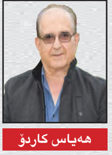
هه باس کارپو

بۆ که س شاراره نییه خهباتی رزگاریخوازانه ی خه لکی کوردستان له ئێران، بۆ گه یشتن به مافی نه ته وایه تی، مافی به رابه ری و عداله تی کومه لایه تییه. له وه تی کورد خهباتی خۆی دریزه دها، هه یجکات مه یلی سه ره رووی و ته ما حکارانه ی نیشان نه داوه. هه یچکات نه یویستوه په لامار به ریته سه ر ماف و ژبانی هه یج نه ته وه و لایه نیکی دیکه. به هه موو دهنگی خۆی هاواری کردوه که هه موو گه لانی نیشته چی ئێران مافی وهک یه کبان له هه لبژاردنی چۆنه تی ژبانی خۆیانا هه یه. هه یچکس له که سی دیکه نه زیاتره و نه که متر. ئه وه ندیه خه لکی کوردستان بۆ ئازادی و مافی ژبانیکی ئاسوده ی باقی به شه کانی ئێران خهباتی کردوه و خۆینی داوه، هه یچکات ئه و هاو ده نگیه ی وه رنه گرتوه ته وه. دیاره سه ره کبترین دۆزمنی ماف و ئازادییه کانی خه لکی کوردستان و گشت ئێران، ده سه لاتی سه رکوتکه رانه ی کوماری ئیسلامیه که به رده وام خه لکی کوردستانی په لامار داوه، مالی ویران کردوه و کوشتاری لی وه ری خستوه. له ژیر ده سه لاتی ئه و ریژیمه دژی ئیستایه دا، گه له که مان رۆژ له گه ل رۆژ زیاتر چه وساو ته وه و زو ملی لی کراوه. له ماوه ی نزیکی نیو سه ده ده سه لاتی ره شی ئه م ریژیمه دا خه لکی کورد زیاترین زبانی وی که وتوه. زۆرترین کوشتاری لی کراوه. له بییه شی زیاترا راگیراوه. زیاترین هیزی سه رکوتکه ری بۆ ره وانه کراوه. که مترین پلانی ئاوه دانی و خۆشگۆزه رانیی تیدا به ریوه چوو. به شی زۆری ئیعدام و زیندانی لی بیا رواه و که مترین مه جالی ژبانیکی ئاسوده ی بۆ دا بین کراوه. ئه گه ر خه لکی کوردستان ئیستاش خهباتی