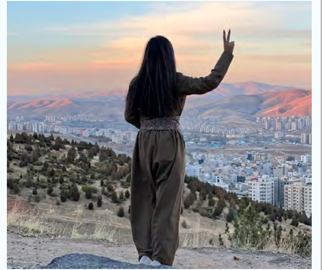
(تحلیل یک چرخش تاریخی)

مسئله‌ی کوردستان در ایران، امروزه از یک مطالبه‌ی صرفاً اتنیکی یا منطقه‌ای فراتر رفته و به تعبیر دقیق‌تر، به نقطه‌ی بی‌بازگشت رسیده است. این بن‌بست‌شکنی تاریخی، بیش از آنکه محصول توافقات سیاسی پشت‌پرده باشد، حاصل یک بلوغ اندیشگی عمیق است که ریشه در