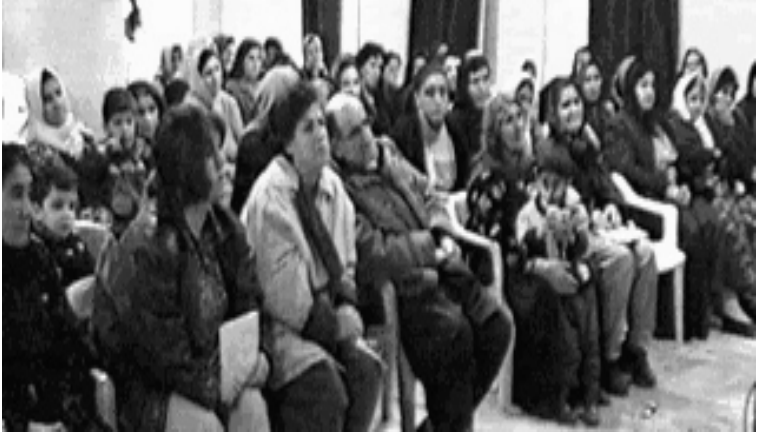
جیهانی‌یه‌و به گوێره‌ی ناماری س‌ندوووقی جمعییه‌تی ریک‌خراوی

له‌قانونی‌یه‌وه‌ی‌س‌اسی‌دا جینگایه‌کیان بۆ له‌به‌رچاو نه‌گیراوه‌و قانون له‌بنه‌ره‌په‌ترا فهره‌نگی‌پیاوسالاری‌به‌رو پ‌س‌ ده‌دا. ماده‌ده‌ قانونی‌یه‌کان‌له‌باره‌ی‌به‌ش‌وودانی کچان،‌ه‌زان‌ه‌ت،‌ته‌لاق،‌میرات،‌شاهیدیدان‌و... هه‌مووی‌به‌قازانجی‌پیاو‌و به‌زیانی‌ژنه‌.