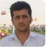
ته هائى رهجيمى

ده زى و پارت و لاپه تانگه ته م پارچه به هوى كومه ليك فاكته رى جوراوجور و بؤ پاراستنى به رزه وه ندى گشتى كورد، جگه له هه نديك جموجمولى وه زرى و چالاكى ميديايى و ريگخستن، به كرده وه پانجا يى خه باتبان له روژه هلات چؤل كورده. له رهوتى ميژوى كوردا به داخه وه كه م هه لكه وتوه هه رسيگ فاكته ره گرنگه گانى سهرگهوتن و سهرگرتنى داوا و خه ونى كورد له پارچه گانى كوردستان و به تايه تى ته وه ولاته ده بيستن؛ سياسه تى جيهانى روژاوا به شوينگه وتن له ته مريكا ته نيا له كورينى رهفتارى ته م سيستمدا خوى ده بيه تيه وه، نهك كورينى بناخه و بن كولى كوله كه له قه گانى ته وه ريژه سهر رويه كه وهك وه ره هميك جگه له كومه گه كى ئيران، ناخى زوربه ي كومه گه گانى ناوچه كه شى داوه شانده و شيرپه نجه ناسا ريشالى نه خوشبى گانى خزانده ته نه خشه ي روژه هلاتى ناقه ته وه. به شينك له كوردستان شينش كه به چاره نووسى تاران وه به ستراره وه ته، به داخه وه له زير زه رويه ننگى ته م سيستمدا داپلوساوه، كه له هه ر ريگه يه كه وه كه لواه، به روه هه لدير و دارمان هه ليشتراره و هه روه وه دهكرى بلين هه نوه كه بزووتنه وه ي ته م پارچه يى كورده ستان كه له سهر تاسى سهرده مى نويه جيهان به تايه تى دواى شه ره كه روه جيهان به تايه تى به رده وام له ترؤيك و په ل ه او يشتن باهوه، ئيسا دور له سهرده مى زيرينى خوى