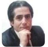
عهلی له پیلخ