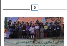
روژی جیهانی ژینگه درهفته تیک بو ژمان