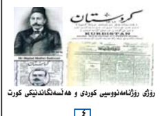
دژی روژانه دیموکراتی کوردی و هه لسهنگاندنی کورت

شایانی باسه له مانگی ده شه مه ی رابردووشا مانگر تته کی سه رانه سه ریی ماموستایانی ئیران به ریه و چه و، نه و ئاگیش وهک ناره زایه تی ده برینی ۲۷ خاکیه لویه، ماموستایانی شاره کانی کوردستان به شیه وه یه کی په کگرتوانه ت و به ریه تتر له ماموستایانی شوپنه کانی دیکه ی ئیران، هاته سه ره شقام، نه مه ش نیشاندهری لیبرایی و به هیژ بوونی ئیراده ی به ره و پشیدهرنی خهباتی مه ده نی له روژه لاتی کوردستانه.