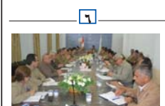
له باسه گرتنه کانی پلینومی دوازه ده می