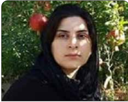
فەرەنك جەمشىدى، خەلگى سەنە، ژىنگە پارىژ و چالاكى مەدەنى كە رۇژى ۸ى پووشەپ بە تۆمەتى چالاكى ئەمىنەتى لەدژى حكومەت دستەسەر كرا.