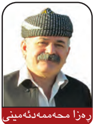
رهزا محهمه ره مین

و تهنیا بۆ له کۆل خۆ کردنهوه بۆ خه لکی مال و حال شیواوی له بهرچا و گرتوو، له چا و تیچووی قورسی کاری بیناسازی ئه ویش له بارودۆخی ئیستادا یه کجار که مه، چونکه ههر له یهک دوو ساله دا نرخی که رهسته ی خانووی بهر دروست کردن وهک هه موو پیدایسته یه کانی دیکه ی خه لکی چه ند قات زیاد کردوو و خه لک به و بره پارویه ناتوان دست بۆ هیچ به بن. ئه و دۆخه به تایبه ت بۆ ئه و بنه مالانه ی کرچی بوون زۆر ناله بارتره. ئه و کومه له خه لکه که به داخه وه ژماره شیان زۆره به هۆی نه بوونی خانو بۆ کر، ههروه ها نه بوونی خزمه تگوزاریه کان، وهک ئاوی خوارده و ی خاوی و ئاوه رۆ و نه خۆشخانه و ژیان له نیو خیه وت و کانیکسه کاندئا تووشی گه لیک نه خۆشی جۆراوجۆری وهک "ساله ک" و په تا ته شه نه ستینه کان بوون. ههروه ها ورده بوومه لهرزه کانی پاش ئه و رووداوه دلته زینه و لافاو و سه رماسۆله و زۆر نه هاهمه تی دیکه وهک ئاگرکه و ته نه وه له خیه وت هه کان زۆر کاره ساتی دلته زینه یی له که وتوه ته وه و خه لکی هه راسان کردوو و به راستی نازان چۆن ژیا نی خۆیان له گه ل ئه و دۆخه ناله باره بگۆنچین. لیکه وته کانی ئه و بوومه لهرزه یه و بی هیوا یی به چاره سه ر بوونی ئازاره کانی له لایه ک و له لایه کی دیکه قهیرانی ئابووری و بیکاری و دابه زینه داها ت و له ئاکلام دا گرانه و هه ژاری، برستی له خه لکی ئه و ناوچه چانه بریوه و بووه هۆی بی هیوا یی به ژیان و له ئاکلاما به زبۆونه وه ی بهرچاوی دیاره ی خۆکوژی له نیو دانیشه وتوانی ئه و پارێزگابه دا.