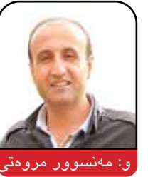
و: مەنسوور مروەتی

هەر وهک له ژماره‌کانی پێشدا باس کرا و له ژماره‌کانی داهااتوویدا وهک زنجیره باس به‌رچاوتان ده‌کەوێ، له دیکتاتوریهوه تا دیموکراسی ناوی توێژینه‌وه‌یه‌کی "جین شارپ"، بیرمه‌ندی ناواری بواری خه‌باتی مه‌ده‌نی و ناتوندوتیژه. شارپ ساڵی ۱۹۲۸ له ئۆهایۆی ئامریکا له‌دایک بووه، دوکتۆرای فه‌لسه‌فه‌ی سیاسی بووه و جیال له ماموستایه‌تی له زانکۆکانی ئامریکا، بۆ لیکۆلینه‌وه له سه‌ر خه‌باتی ناتوندوتیژی سه‌ردانی زۆر و لا‌تی کردوه و ته‌نانه‌ت زۆر جاریش بۆ په‌روه‌رده‌کردنی خه‌لک سه‌ری له و لا‌تانی دیکتاتوریه‌دا وه‌ل‌ناوه و له‌وه گرینگتر له چه‌ند و لا‌تیک خۆی گه‌یاندووته‌ ریزی پێشه‌وه‌ی ناپازییان و تیکه‌ل به‌ خه‌لکی ئازادبێژی ئه‌و و لا‌تانه‌ بووه. کاکلی ئیده‌کانی جین شارپ ئه‌وه‌یه که "دیکتاتۆره‌کان هیزی سه‌ره‌کی خۆیان له گوێزیه‌لی و ملکه‌چی خه‌لکه‌وه وه‌ده‌ست دینن، ئه‌گه‌ر خه‌لک ئاوا ملکه‌چ و گوێزیه‌لی ده‌سه‌لاتداران نه‌بن ده‌توانن دیکتاتۆره‌کان به‌ چۆکدا بێنن یا ده‌نا مه‌جبوو به‌ ئالوگۆریان بکه‌ن." له‌م زنجیره باسه‌دا باس له بنه‌ما فیکریه‌کانی "جین شارپ" بۆ خه‌بات دژی دیکتاتۆری ده‌کړئ: