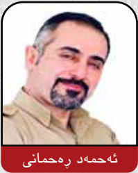
پایزه‌ی زیزه‌ی سروشتی ئازاد زه‌رده‌ی خه‌ملیوه‌ی ولاتی ناشاد

شورش و به‌رخوانی نه‌ته‌وه‌کان په‌رچه‌کرداری ئه‌و زولم و زۆرانیه‌ی که ده‌کریته‌ی سه‌ریان و ناچار به‌ به‌رگرییان ده‌کهن. ئه‌م شوێشانه‌ی په‌یوه‌ندییان به‌ شوێن و هه‌لکه‌وته‌ی جوغرافی و ژئۆپۆلیتیکی ئه‌و ناوچه‌ی که لانه‌ی هه‌یه و زۆر جارێن نه‌ته‌وه‌خوای و ته‌نانه‌ت ئایینی شۆڕشگرێکی گه‌رم له‌م بواره‌دا ده‌گه‌ڕێ. هه‌ندیک له‌ شوێشه‌کان ماوه‌یه‌کی زۆر ناخایه‌نی و ده‌گه‌ن به‌ ئامانجه‌کانیان و هه‌ندیکه‌یان هه‌ر زوو کپ ده‌کری، هه‌ندیکه‌یان له‌وان دوا‌ی کپ‌کردنیشیان بیری ئازادخوایان دانامرکی و ماوه‌ی دوا‌ی ماوه‌ی سه‌ر هه‌له‌ده‌نه‌وه‌ی، وه‌ک بزوو‌ته‌وه‌ی کورد که‌ چه‌ندین سه‌ده‌یه‌ی ده‌ریزه‌ی هه‌یه و سه‌نگه‌ری خه‌باتی رۆله‌کانی ئه‌م نه‌ته‌وه‌یه هه‌ر ئاوه‌دانه. ئه‌م بزوو‌ته‌وه‌ی کورد ئه‌گه‌رچی به‌ هۆکاری جو‌راو‌جو‌ر توشی ناسکری بوون، به‌لام گه‌ری بیری نه‌ته‌وه‌یه‌ی و هه‌ستی نیشتمان‌په‌روه‌ری تا ها‌توه‌ پتر بلیسه‌ی سه‌ندوه.