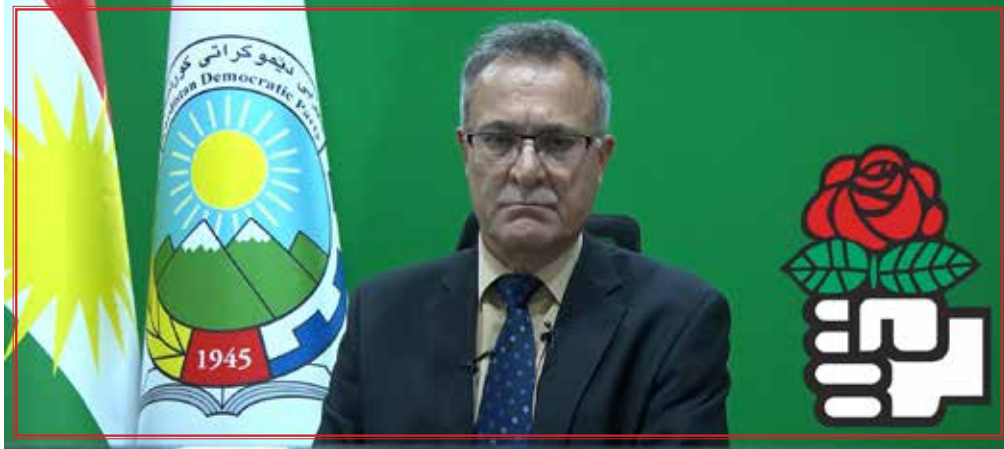
(دەقی قسەکانی سکرێتری گشتیی حیزب لە کۆبوونەوی گروپی کاری کوردان لە ئەنترناسیۆنالی سۆسیالیست)

ئاشتیانەیی کوردان بۆ وتووێژ دانەنا. بە پێچەوانە، ئەو بە ھیزی سەربازی ھیرشی کردە سەر کوردستان و شەریکی دووردریژ و خۆناویی بەسەر گەلی کورددا سەپاند کە تەنەت تا ئەمرۆ بە شپۆی جۆراو جۆرە دریژە ھەبە. لە ماوی زیاتر لە چوار دەیە، کۆماری ئیسلامی سیاسەتی نەگۆری دژی گەلی کورد رەچاوە کردووە کە پێکھاتوو لە: سەرتکوت، تیرۆر، ئێعدام، دەستبەسەر کردن و سەپاندنی حوکمی قورس بەسەر چالاکانی سیاسی و کۆمەلگە مەدەنی، و لە ھەمان کاتدا بە ئامرازی ئەمینییەتی کوردستان ھەلاواردە دەکا.