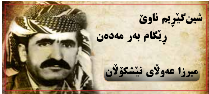
شین گپیم ناوی