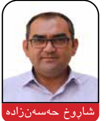
شاروخ هەسەن زادە

رەشەممە ۱۳۹۹ "سەعید لەیلان"، ماموستای زانکۆی "بەهێشتی"ی تاران و بەرپررسی "ئێران خۆدرو دیزیل" چاوپێکەوتنێکی سێ کاتژمێر و ۱۱ خولەکێ دەگەڵ وەزیری دەرەوی کۆماری ئیسلامی ئێران، "محەممەد جەواد زەریف" کردوو کە لە ۵ی بانەمەری ئەمسال بەشیوەیەکی گومانناوی کەوتە دەست کانیایی میدیایی دەرەوی و بلاو کراو. ئەو چاوپێکەوتنە دووردریژە کە بە قسەی خۆیان ئامانجیان ئەوە بوو وەک مێژووی زارەکیی دەولەتی ۱۲-هەمی ئەو رێژیمە تۆمار بکری و لە شوینی خۆ هەل بگێری و لەکاتی خۆیدا بلاو بکری، ئەو هەلای زۆری لە ئاستی نیوخۆیی، ناوچەیی و نیودەولەتی ساز کردوو بە جۆریک وەک باسی رۆژەقی میدیا جیهانییەکانی لێ هاتوو. لێرەدا و لە چەند ئێپیزۆددا هەلسەنگاندنی بۆ دەکەین.