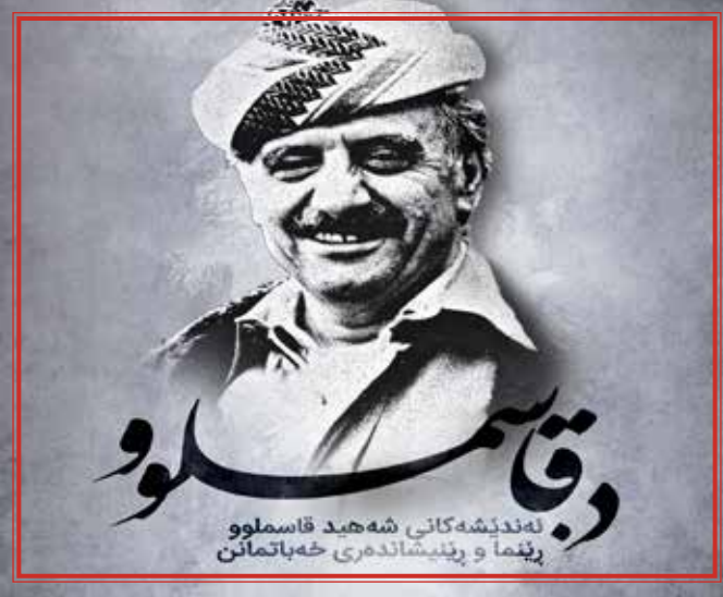
ښه‌ید قاسملوو ریژیم و ری‌نیشاندیری خه‌پاتمان

(ږاگه‌یاندن‌وی ناوه‌ندی هاوکاری‌ی حیزبه‌کانی کوردستانی ښیران به‌بؤنه‌ی ۳۲ه‌مین سالوه‌گه‌ری تیرووی د. قاسملوو و هاوپنیانی)