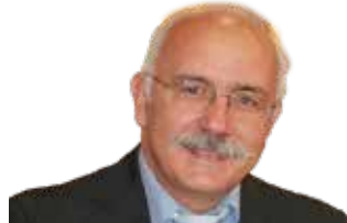
«گیرۆده یی» نه خۆشییه کی درێژخایه ن و جیهانی