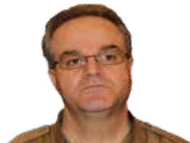
ئو هه موو رق و قینه دزی کورد له کوێ وه سه رچاوه ده گری؟