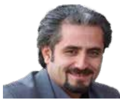
سیاسه تی زانکردنی یه ک زمانه ی خه ساره کانی