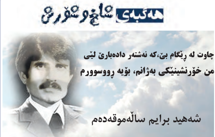
جاوت له‌ ریکام بی، که‌ نه‌شته‌ر داده‌بارئ لیی من خۆرنشینگی به‌زانم، بۆیه‌ رووسوورم

"جان راولز" بنه‌ماکانی دادپه‌روه‌ری له‌سه‌ر بنه‌ره‌تی دوو جۆر ئازادی بۆ هه‌موو هاوولاتیان دادپه‌رپه‌ژێ: ئازادیی باوه‌ر و ئازادیی راده‌برپه‌ن. ئه‌و ده‌رفه‌ته‌کانی گه‌یشتن به‌ دادپه‌روه‌ری وه‌ک به‌هایه‌کی کۆمه‌لایه‌تی سه‌یر ده‌کا و له‌ بۆچوونه‌کانیدا باسی نه‌ته‌وه‌ باش په‌روه‌رده‌کراوه‌کان و "مافه‌کانی خه‌لکانی باش" دپه‌ته‌ گۆری و بنه‌ماکانی له‌ چوارچه‌وییه‌ "گرێبه‌ست و به‌رپه‌رسایه‌تییه‌کان" دا دادپه‌رپه‌ژێ. دانانی ئه‌و خواسته‌ش له‌لایه‌ن خه‌لکه‌وه‌ به‌په‌ی ئه‌وه‌ که‌ ریکه‌وته‌تاکان" مافی وه‌که‌یه‌ک بۆ هه‌مووان له‌ به‌رچاوه‌ ده‌گرن، بنه‌ره‌تی دادپه‌روه‌ری له‌سه‌ر بناغه‌ی یه‌کسانی گشتگیر پیتاسه‌ ده‌کا. به‌لام له‌ به‌رانه‌ر ئه‌و خه‌لکه‌ باشه‌دا زۆرچار حکومه‌تی یاخی و پیشیلکهری یاساش قوت ده‌بنه‌وه‌ که‌ به‌ توانندی هیز و ده‌کارکردنی زه‌برۆزنگ ده‌خوازن به‌ زه‌وت‌کردنی مافی خه‌لک و پیشیلکردنی ئه‌و ریکه‌وتنه‌، خه‌لک و هه‌مووان ناچار به‌ ملراکیتشان بۆ داخوازه‌ ناره‌واکانیان بکه‌ن. کۆماری