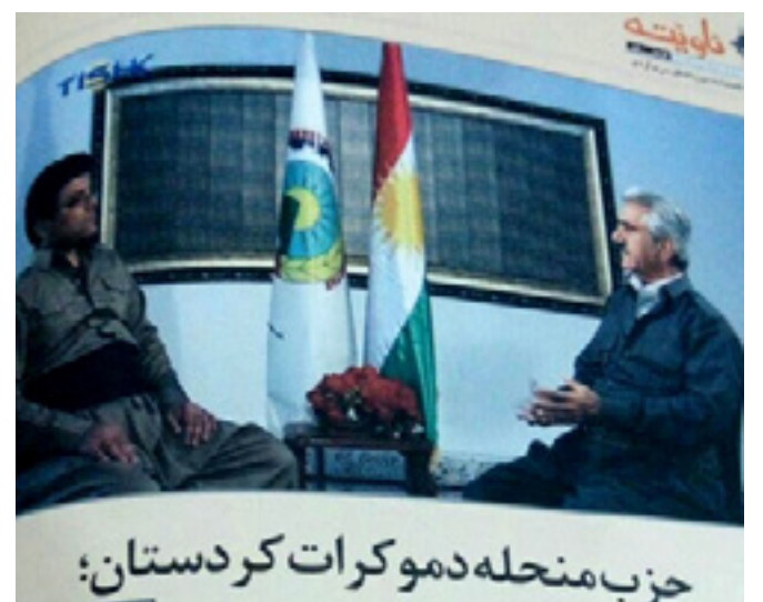
حزب منحلده دموکرات کردستان

نشریات و مجلاتی علیه خیزش نوین کردستان ایران توسط بخش تبلیغات و اطلاع‌رسانی قرارگاه تروریستی "حمزه سیدالشهدا" واقع در ارومیه چاپ و انتشار یافت. بر اساس گزارش رسیده به وب‌سایت کردستان میدیا، در ادامه‌ی تبلیغات رژیم علیه راسان کردستان ایران، این‌بار انتشارات سپاه تروریستی پاسداران در اقدامی مذبح‌خانه، به چاپ نشریات و مجلاتی سفیخ روی آورده است. در این رابطه، بخش تبلیغات و اطلاع‌رسانی قرارگاه ضد بشری موسوم به "حمزه سیدالشهدا" واقع در ارومیه با چاپ نشریات و مجلاتی، انگ‌های ناروایی به جنبش ملی - دمکراتیک