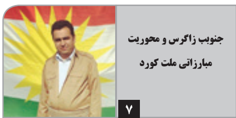
جنوب زاگرس و محوریت مبارزاتی ملت کورد