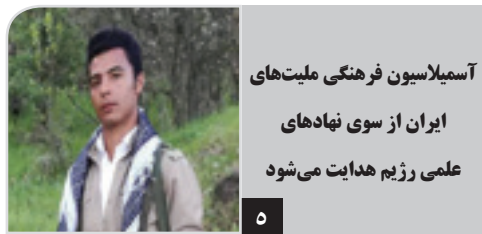
آسمیلاسیون فرهنگی ملیت‌های ایران از سوی نهادهای علمی رژیم هدایت می‌شود