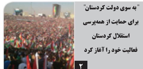
"به سوی دولت کوردستان" برای حمایت از همه‌پرسی استقلال کوردستان فعالیت خود را آغاز کرد