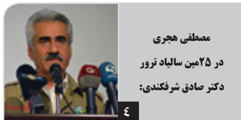
مصطفی هجری در ۲۵مین سالگرد ترور دکتر صادق شرفکندی: