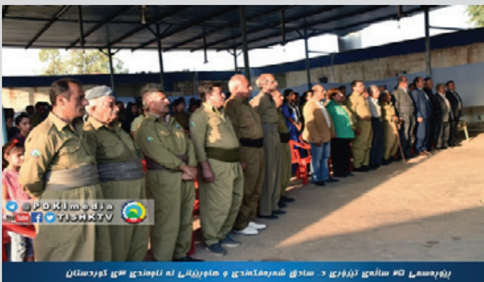
روز جمعه ۱۷ شهریور ۱۳۹۶ در سالن شهرداری و همایشی که نامگذاری کوردستان