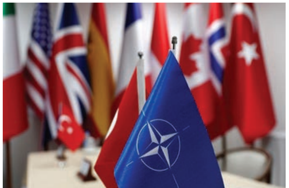
Pêşkêşkara "Fox News"ê jî dibêje ku di rastî de Kurd hevalbendê herî rastbêj in digel Amerîkayê.

Jiber ku Kurdan di şerê li dijî terorê de xwîna xwe rijandine, dibe ku di warê exlaqî de, em pişt a wan bigrin, û em deyndarê wan in û Kurd dibe bêne parastin.