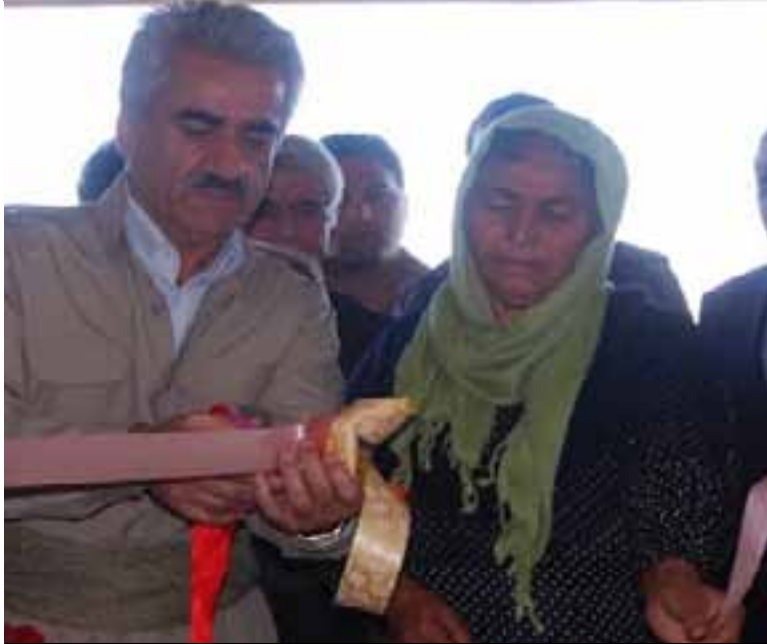
Birêz Mistefa Hicrî û hevîna şehîd Xale Şêx Mihemed Bilbasî di dema vekirina hola wênayên şehîdan de