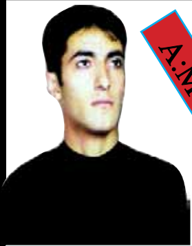
A. Mecîd Rajanî

Şaristana Şahabadê (Îslamabad) yek ji Şaristanên parêzgeha Kirmaşanê ye. Şaristana han bi panahiya 3828 kîlomêtrên çargoşe li başûrê vê parêzgehê de cih girtiye. Şahabad ji aliyê bakûr tevî Şaristanên Pawe û Ciwanro û ji aliyê rojhilat tevî Şaristanên Serpêla Zehw û Gîlana rojava û ji aliyê başûr tevî parêzgeha Îlamê hevşînor e.